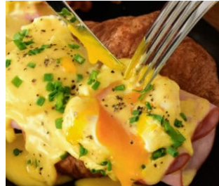
Croissant Royale €11

Brioche in Vanille-Ei-Milch getaucht, goldbraun gebraten und serviert mit Beeren, Vanillesauce & einer Prise Zimt