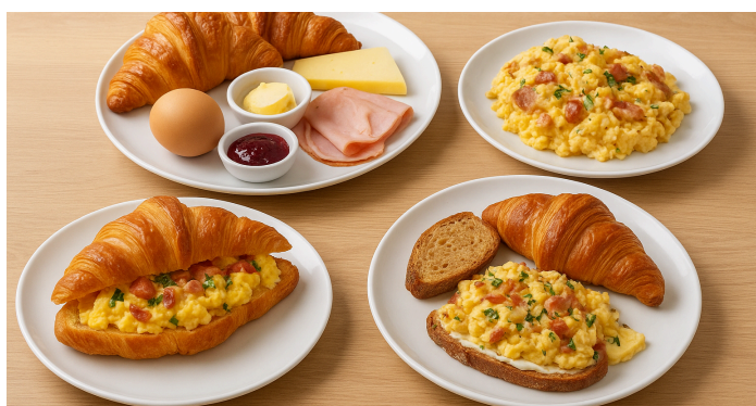
Golden Egg €9

Aromatische Tomaten-Paprika-Sauce, mild gewürzt mit darin pochierten Eiern, serviert mit frischen Kräutern und Brot - herzhaft und mediterran.