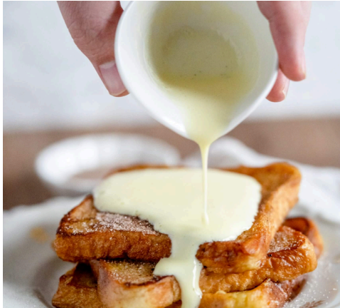
Golden Morning - French Toast