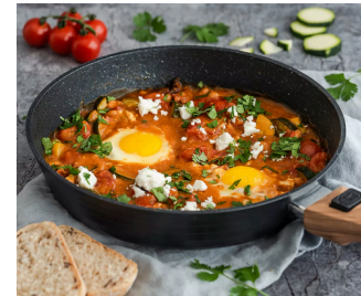
Red Sun Shakshuka €15

Serrano-Schinken, Baby-Spinat, Avocado, Käse & Ei vereint im leckerem Toast - sonnig, würzig, glücklich